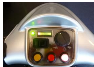
Einfach zu bedienendes Display!

Alpine-Getriebe zur Erhöhung der Steigfähigkeit optional verfügbar! VK brutto 1.569,-