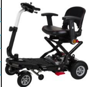
Elba Carbon Variante!

Die Bedienungsanleitung und die Explosionszeichnung finden Sie unter www.aktivdeutschland.de